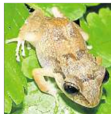
Pfeiffrosche sind zwar klein, aber können laut musizieren.

ber, bietet der Palmengarten eine Abendführung an, die sich ausschließlich in den kleinen Akteuren dieses lauten Spektakels widmet.